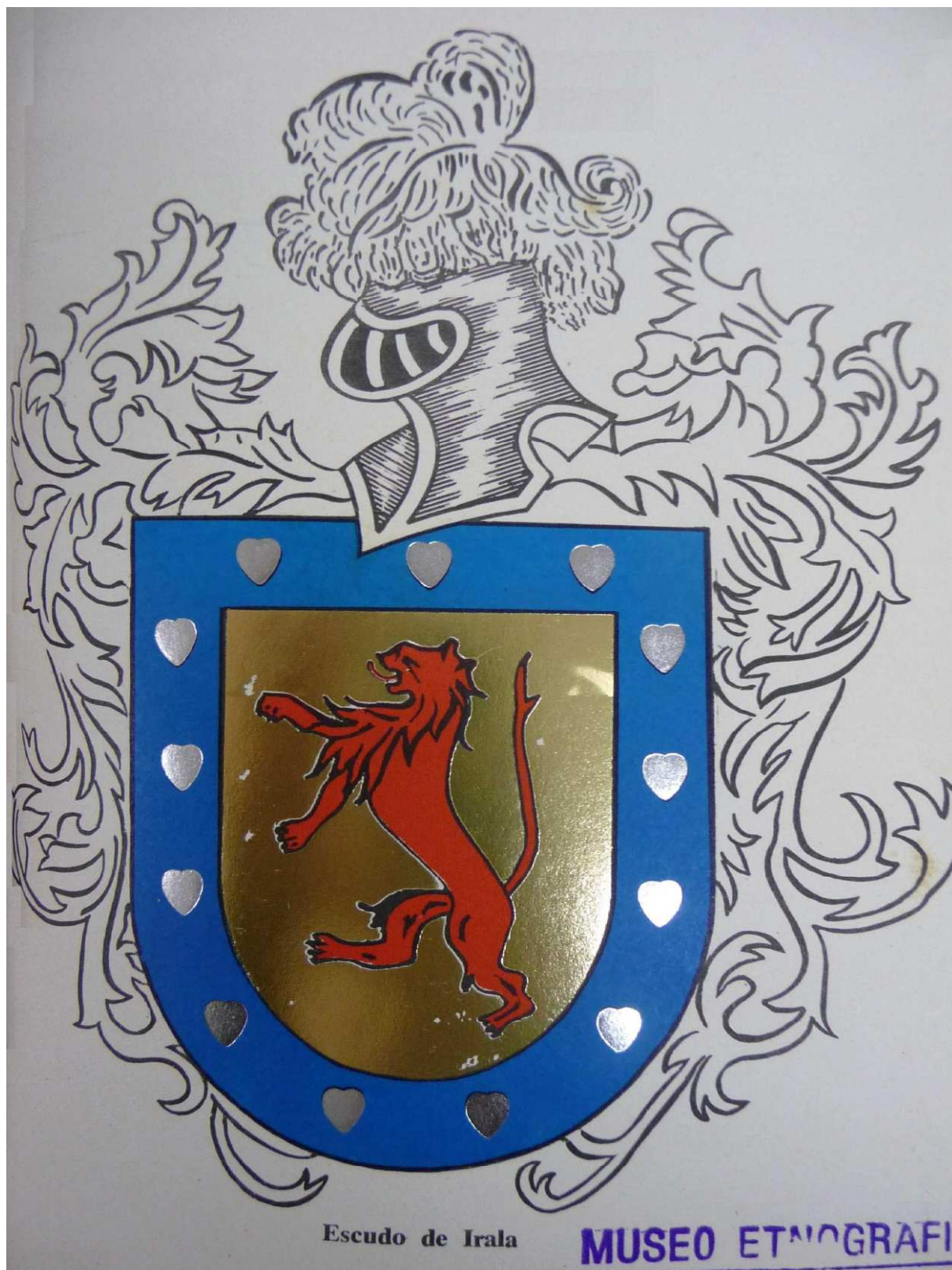
Blason de Domingo Martinez de Irala.